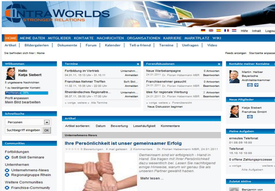
Abb. 1: Beispiel unserer Plattform: das IntraWorlds-Demo-Portal

Unsere einzigartigen Social Community-Lösungen vereinen attraktive Networking- mit effizienten Verwaltungsfunktionen. Intuitive Bedienbarkeit, vielseitige Funktionen und die Verfügbarkeit in zahlreichen Sprachen zeichnen die IntraWorlds-Communities aus.